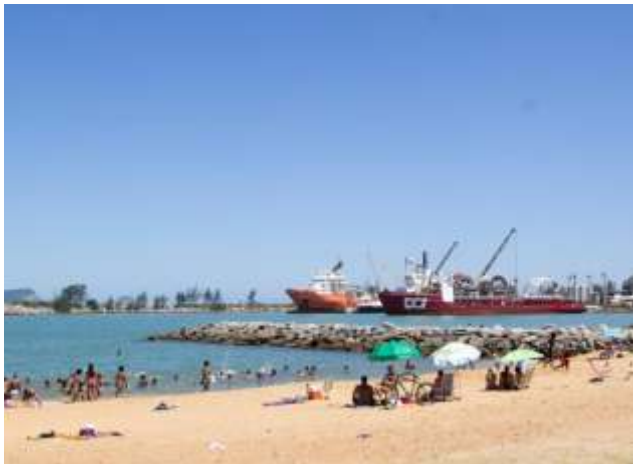
Imagem 05 – Praia de Imbetiba em dia de verão com curiosa interação entre pessoas e a paisagem modificada pela indústria do petróleo - 2019