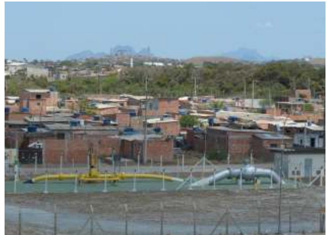
Imagem 06– Comunidade da periferia macaense atravessada por tubos da Petrobras.

Talvez aqui possamos ampliar o entendimento em torno da conhecida expressão “a maldição do petróleo” (ROSS, 2015), originalmente vinculada à inibição que a cadeia do petróleo gera à diversificação de atividades econômicas no seu entorno, tragando para o seu seio, como num tropismo de desejos e representações (CHARTIER, 2002), a lógica de se viver em sua área de influência ou domínio. E entendê-la também como a condição que, apesar de ter possibilitado a inclusão de inúmeras famílias no mercado e a realização de seus sonhos a partir dessa cadeia produtiva, fomentou, no sentido oposto, ao lado da produção de tanta riqueza e tecnologias e independente dos tempos de bonança ou de crise, a exclusão social em variadas representações práticas e cotidianas. Assim, pois, nesse segundo momento, o da crise propriamente dita, ou a CRISE entendida e/ou expressada com letras maiúsculas, as percepções tornam-se mais sensíveis, porque se a bonança tem a capacidade de gerar os grandes fossos sociais, embora com a sensação de que tudo está bem, a crise tem o poder de irmanar os indivíduos e tocar as autoridades, ainda que seja pelo viés do sofrimento e da escassez, representantes legítimos e em potencial do sistema capitalista mundial ao qual a economia do petróleo se vincula em absoluto.