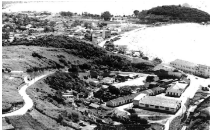
Imagem 02 - Vista aérea das Oficinas Ferroviárias de Imbetiba - Década de 1970

A febre pelo “ouro negro” gerou uma imagem fictícia e idealizada da realidade, baseada na impressão de estabilidade e bonança até que os mais leves e depois os fortíssimos impactos da crise iniciada em 2014 chegassem na forma de demissões, fechamentos de empresas e desmonte da estrutura da cadeia produtora de óleo e gás até então em crescimento. O conceito de progresso definido pelo centro dessa sociedade como sinônimo de crescimento econômico vulnerável nunca foi consenso em sua própria periferia (MARTINS, 1992). Porque mesmo em uma sociedade produtora de tamanhas riquezas, os benefícios dessa produção se mantiveram fortemente descontinuados, gerando a Macaé partida entre o pertencimento e a exclusão.