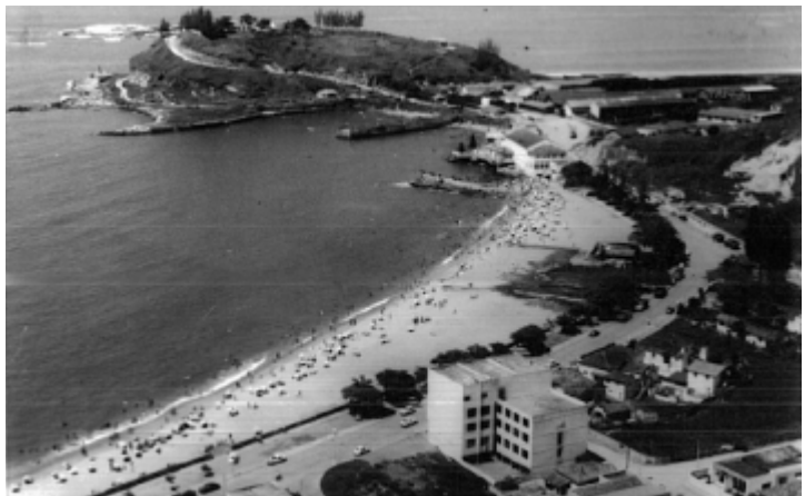
Imagem 03 - Vista aérea da Praia de Imbetiba na década de 1970