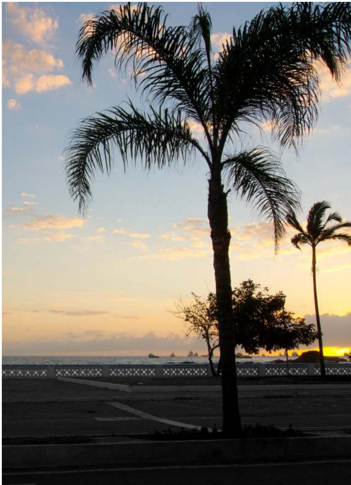
Imagem 07- Rua da Praia com foz do Rio Macaé e Oceano ao fundo - 2019