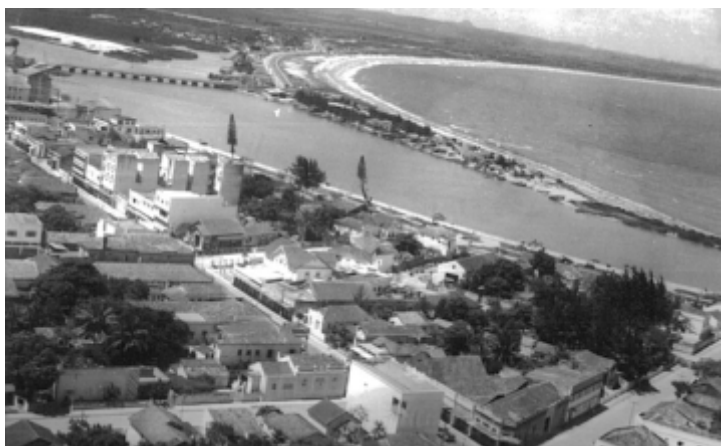
Imagem 04 - Vista aérea do centro da cidade de Macaé na década de 1970