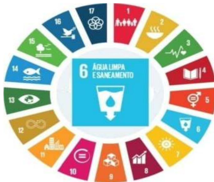
Figura 3.: Os Objetivos de Desenvolvimento Sustentável e a centralidade do ODS 6

agora e/ou no futuro. Sem água, substância essencial para a vida, em âmbito geral, e para a promoção do bem-estar das pessoas e do seu desenvolvimento econômico, em termos específicos, estabelece-se uma condição de pobreza de parcelas da população (LUNA, 2007), investigada pela ONU por meio do emprego do IPH – Índice de Pobreza Hídrica. Em função da carência de indicadores que atestem a relação entre a pobreza da população e a disponibilidade de água e saneamento, integrando questões simultaneamente pertinentes aos ODSs 1 e 6, o IPH foi adaptado para o âmbito local e empregado em duas localidades situadas na região estuarina da bacia hidrográfica do rio Macaé, caracterizadas como ocupações urbanas com padrão socioeconômico e de infraestrutura distintos: a Ilha Colônia Leocádia e a Ilha da Caieira (GUIMARÃES, 2019).