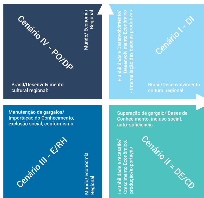
Figura 2: Cenários de desenvolvimento apresentados no Plano de Recursos Hídricos da Região Hidrográfica VIII do ERJ

Os cenários apresentados no PRH-RH8 (Figura 2) foram modelados de forma a contemplar a disponibilidade (oferta) hídrica da bacia do Rio Macaé e o consumo por todas essas atividades socioeconômicas: I – cenário de desenvolvimento integrado/emergência (desenvolvimento econômico e internalização das cadeias produtivas); II – cenário de desenvolvimento endógeno/conciliação na divergência (superação dos gargalos ao desenvolvimento em âmbitos regional e nacional); III – cenário de perda de oportunidade/desenvolvimento perdido (não-superação dos gargalos ao desenvolvimento); e IV – Cenário de estagnação/repetência em história (instabilidades a nível mundial, nacional e regional, com redução da dinâmica das cadeias produtivas associadas aos combustíveis fósseis e estagnação econômica regional), que se concretizou durante os últimos anos no município de Macaé e região, sendo chamado de "Crise do Petróleo". As ofertas hídricas foram avaliadas com base em séries históricas de dados hidrológicos de estações de monitoramento, complementada utilizando-se técnicas de modelagem hidrológica e regionalização de parâmetros, empregando dados de chuva e de vazão no período de 1971 a 1990 para calibração do modelo, submetido à verificação, com dados do período de 1991 a 2011, de forma a gerar séries de vazão por trechos dos corpos hídricos.