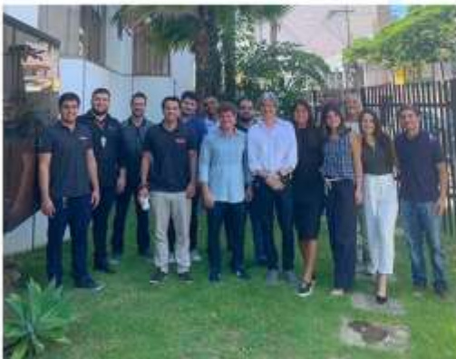
Visitas de empresas como a Petrobras;