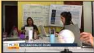
Startup Macaé incentiva quem tem e quem busca soluções tecnológicas