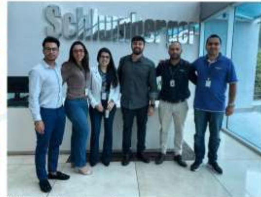
Visitas Técnicas à grandes empresas;