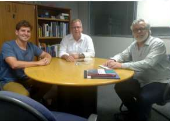
Articulação com parceiros estratégicos;