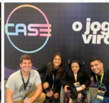
Juntos com a ABstartups;