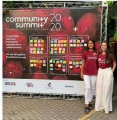
Capacitação da equipe;