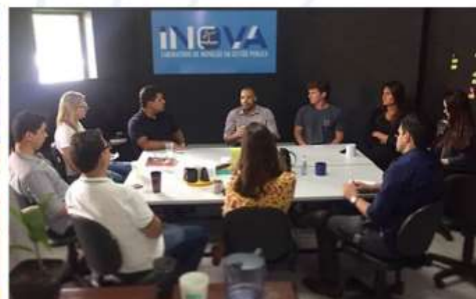
Integração com as universidades;