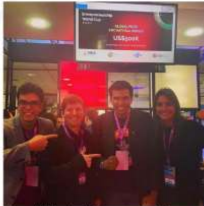
Copa do Mundo de Empreendedorismo;