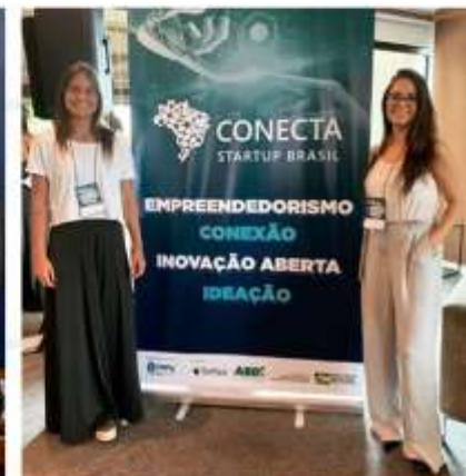
Participação em eventos;