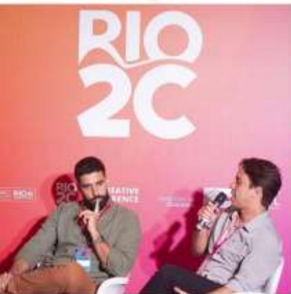
Participações no Rio 2020;