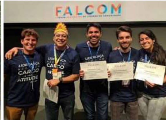
Representação de Macaé em grandes eventos;