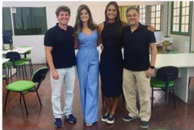
Parceria com o Startup Rio;