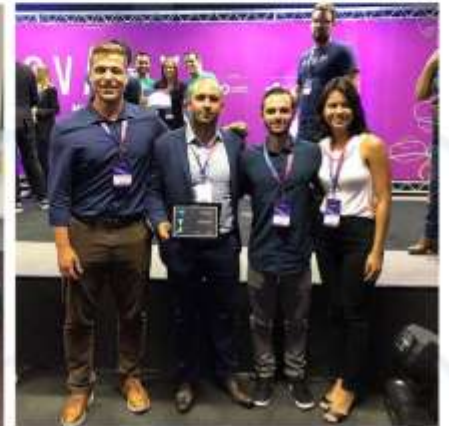
Premiações em grandes eventos;