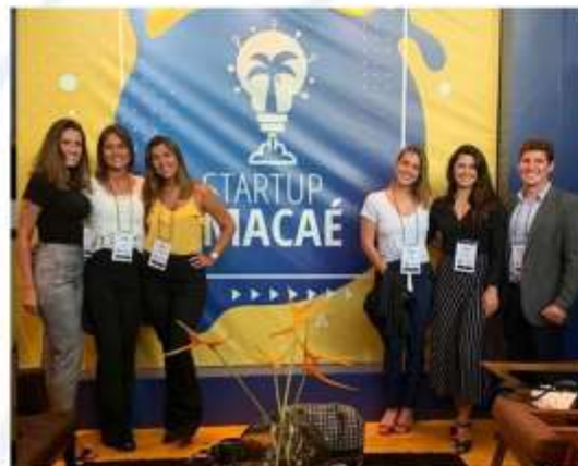
Lançamento do Programa na Brasil Offshore;