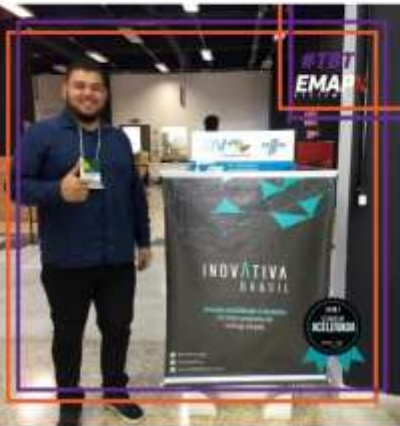
Participações no Inovativa Brasil;