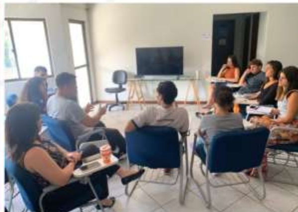
Encontros com Empresas Juniores;