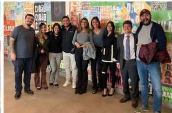
Benchmarking com Programas de Sucesso;