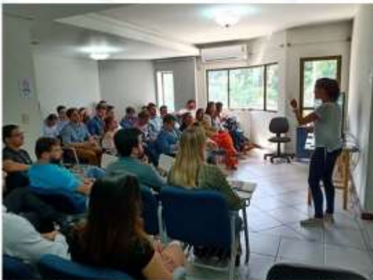
Integração com Programas corporativos de inovação;

Ao longo deste primeiro ciclo, o Startup Macaé inseriu, de forma definitiva, Macaé no cenário brasileiro de inovação e empreendedorismo. As sólidas parcerias com grandes empresas e universidades, bem como a capacitação tecnológica e formação de um tecido social empreendedor, são conquistas fundamentais para o desenvolvimento de um ecossistema de inovação pujante, que será, sem dúvidas, o maior legado deste Programa. Finalizamos este relatório com imagens de momentos marcantes deste nosso primeiro ano.