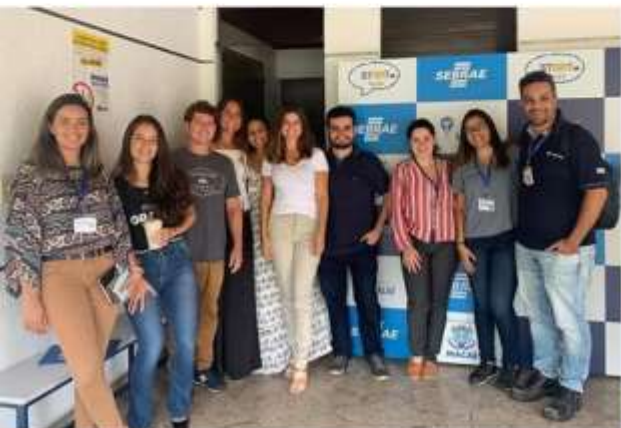
Sinergias com empresas de Petróleo;