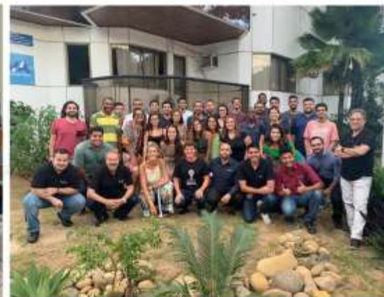
Empreendedores 100% engajados;