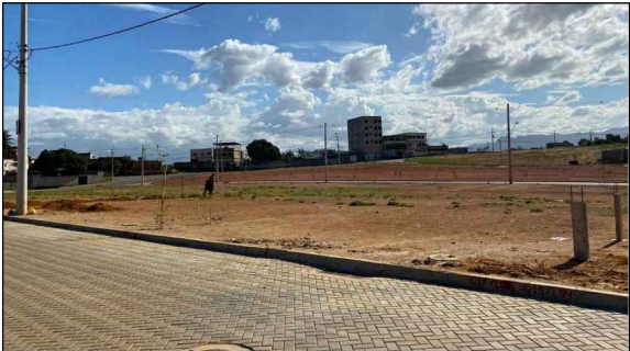
IMAGEM ATUAL DO TERRENO